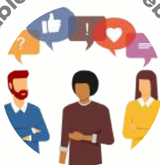
Table ronde et débat